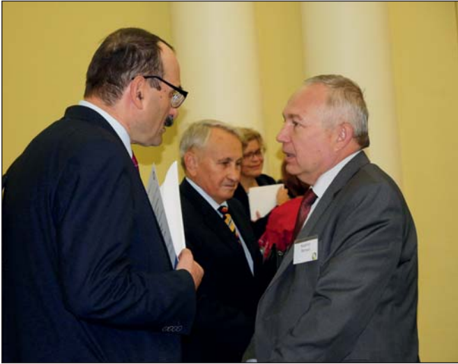
У кулуарах засідань: професор М. Стріха, академіки НАН України Я. Яцків і Р. Кушнір

Доповідь під назвою «Наукове товариство ім. Шевченка: 145 років, присвячені розвитку науки та освіти в Україні» зробив голова Українського відділення Товариства академік Роман Кушнір (Інститут прикладних проблем механіки і математики ім. Я.С. Підстригача НАН України, м. Львів). Саме у Львові в грудні 1873 р. і було засновано Товариство ім. Шевченка, яке 1892 року перейменовано на Наукове товариство ім. Шевченка (НТШ). Як наголосив доповідач, це була перша національна академічна інституція, організована зусиллями культурних діячів Західної та Східної України. У своєму розвитку вона пройшла декілька етапів, за змістом багато в чому співзвучних із звитяжною та трагічною історією становлення української держави.